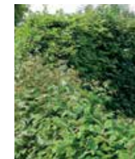
Gemengde haag met rode kornoelje en meidoorn

Tip: hoe breder de haag, hoe meer schuil- en nestgelegheid. Laat de haag dus minstens 70 cm breed worden.