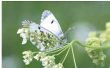
Oranjetipje - Anthocharis cardamines

Sommige insecten hebben een duidelijke voorkeur voor bepaalde plantensoorten: het elzahaantje (een klein, donkerblauw, glanzend kevertje) leeft uitsluitend op elzenstruiken; sommige galwespen hebben eiken nodig om hun eitjes te leggen; de meikever is in belangrijke mate achteruitgegaan door het verdwijnen van haagbeuk... Het voortbestaan van deze soorten is dus onlosmakelijk verbonden aan het lot van de waardplanten