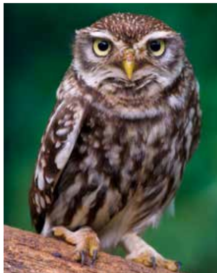
Steenuil - Athene noctua

De rijke variatie aan insecten, spinnen, slakken, wormen... die er te vinden is, vormt voor insectenetende vogels dan weer een feestmaal. Bramen maken van een houtkant soms een haast ondoordringbare muur. Met nog wat hondsroos, meidoorn of sleedoorn ertussen wordt het geheel een oninneembare vesting waar eitjes rustig uitgebroed