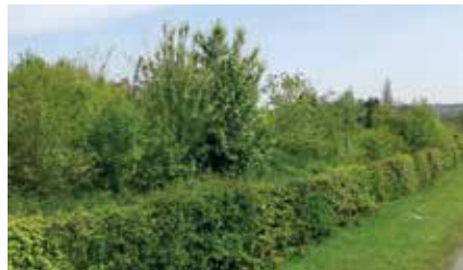
Geschoren haag met daarachter gemengde heg

Houtkanten, vogel- en nectarbosje: De eerste twee jaar na het planten beperkt het onderhoud zich tot het vrijhouden van de spilletjes of struikjes. Een goede mulchlaag van bijvoorbeeld gehakseld hout kan dit werk grotendeels opknappen, of je kiest bij aanplant voor inzaaien met klaver om de bodem te bedekken. Na twee jaar wordt de beplanting kort afgeknipt of afgezaagd, tot op ongeveer 15 cm boven de grond. Dit is winterwerk, wanneer de struiken bladerloos zijn. Uit de overblijvende slapende knoppen van het resterende stammetje lopen in de lente nieuwe scheuten uit. Deze scheuten mogen enkele jaren ongestoord hun gang gaan.