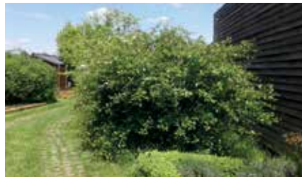
Heg met sleedoorn en bloeiende meidoorn