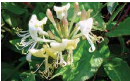
Wilde kamperfoelie - Lonicera periclymenum

Hagen, heggen en houtkanten zijn niet alleen een leefwereld voor dieren. Ook talloze kruiden en bloemen vestigen zich er spontaan. In echt oude hagen en houtkanten kan men typische bosplanten zoals bosanemoon, speenkruid en gevlekte aronskelk en ook heel wat klim- en slingerplanten aantreffen. Afhankelijk van de rijkdom van de grond kan je er wilde kamperfoelie, hop, bitterzoet, klimop en heggerank vinden. Wilde kamperfoelie trekt met zijn welriekende bloemen op zijn beurt voornamelijk nachtvlinders aan omdat de plant zijn zoete geur pas bij valavond verspreidt.